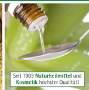
Entwicklung und Herstellung im eigenen Haus