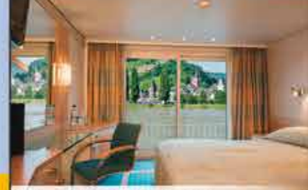
Kabinenbeispiel, 4++ VIKTORIA