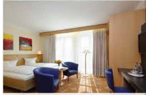
Zimmerbeispiel, 3+ Hotel Füssinger Hof