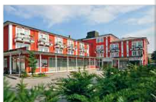
Außenansicht, 3+ Hotel Füssinger Hof