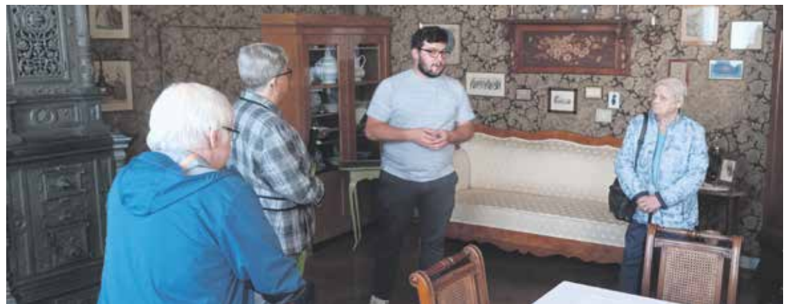
Im Museum für bürgerliche Wohnkultur gab es einen Blick in früher übliche Wohnstuben.