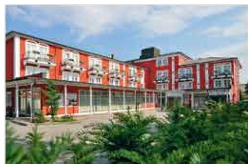
Außenansicht, 3+ Hotel Füssinger Hof

Freizeit/Kur/Unterhaltung: Entspannung finden Sie u.a. auf der Liegewiese oder in der hoteleigenen Therapieabteilung, wo Ihnen gegen Aufpreis unterschiedliche Massagen angeboten werden. In der größten Therme Deutschlands, der Johannesbad Therme, stehen Ihnen zahlreiche Becken im Innen- und Außenbereich zum täglichen Thermalbaden kostenfrei zur Verfügung.