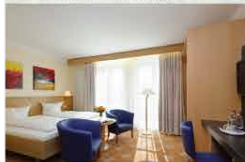
Zimmerbeispiel, 3+ Hotel Füssinger Hof