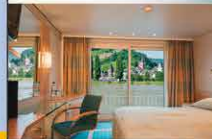
Kabinenbeispiel, 4++ VIKTORIA