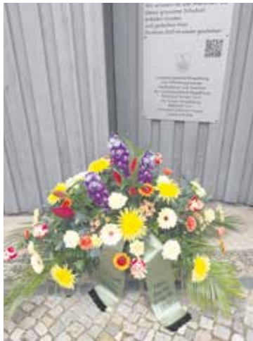
Die Blumen stammen von den SoVD-Frauen.