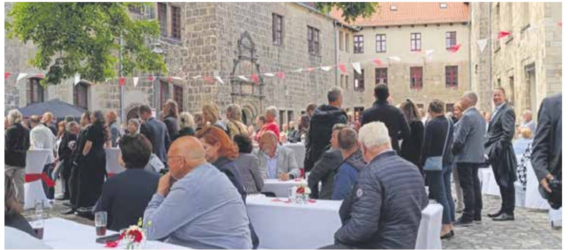
Auf dem Sommerfest der Stadt hatte der SoVD die Möglichkeit, Kontakte zu knüpfen.

Am Ende des Besuchs saßen alle aus der SoVD-Gruppe bei Kaffee und Kuchen noch zusammen und konnten sich über das Gesehene und Gehörte austauschen.