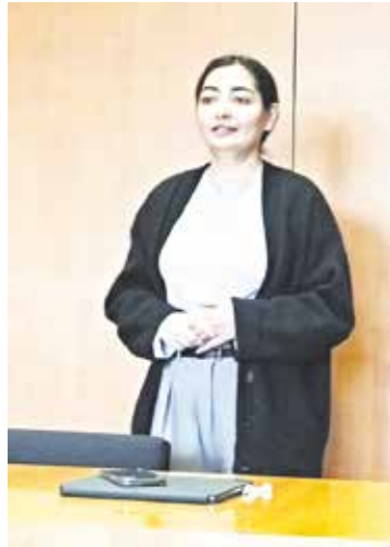
Reem Alabadi-Radovan (MdB) hatte den SoVD eingeladen.

Am 14. Juni führte die zweite Tagesfahrt die Mitglieder nach Berlin. Auf Einladung der Bundestagsabgeordneten Reem Alabadi-Radovan (SPD) konnten die 46 Teilnehmer*innen im Paul-Löbe-Haus mit der Politikerin reden. Die aus Mecklenburg-Vorpommern stammende Alabadi-Radovan zog 2021 mit einem Direktmandat in den Bundestag ein. Am 8. Dezember wurde sie zur Staatsministerin für Migration, Flüchtlinge und Integration benannt. Am 23. Februar 2022 übernahm sie zusätzlich das neu geschaffene Amt der Bundesbeauftragten für Antirassismus. Seit August 2022 ist Alabadi-Radovan stellvertretende Landesvorsitzende