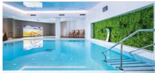
Schwimmbad, 4+ Resort Reitenberger

Freizeit/Kur/Unterhaltung: Das Resort besitzt eine Kurabteilung mit Schwimmbad (9 x 6 m, ca. 29°C), Whirlpool, Saunabereich mit Dampfbad und einem Fitnessraum (kostenfrei außerhalb der Therapiezeiten). Zudem verfügt das Haus über eine Salzgrotte (gg. Gebühr).