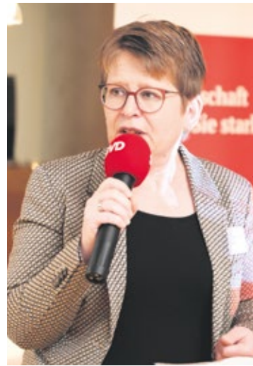
Tanja Machalet, rentenpolitische Sprecherin der SPD-Fraktion.