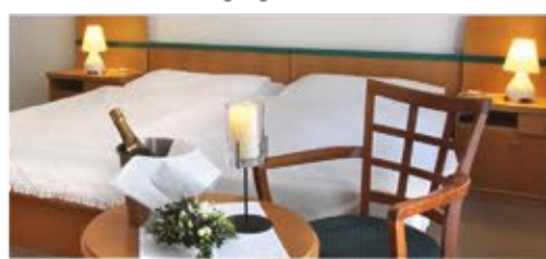
Zimmerbeispiel, 3+ Hotel Maxim

Freizeit/Kur/Unterhaltung: Der Komplex verfügt über einen eigenen Kurbereich, in dem alle gängigen Kur-Anwendungen geboten werden. Des Weiteren steht Ihnen das Schwimmbad (8 x 4 m, ca. 29°C) außerhalb der Therapiezeiten zur Verfügung.