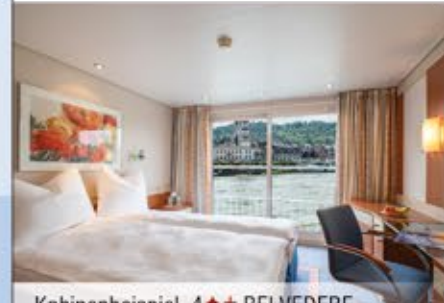
Kabinenbeispiel, 4++ BELVEDERE