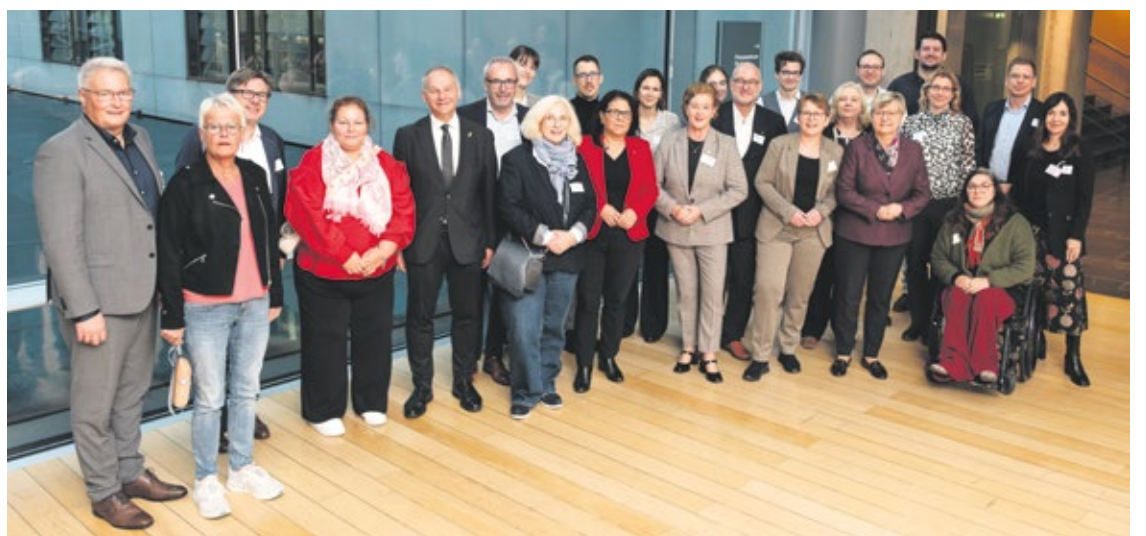
Nach dem Frühstück ging es ins Plenum. Etliche MdB standen vorher noch fürs Gruppenfoto bereit.