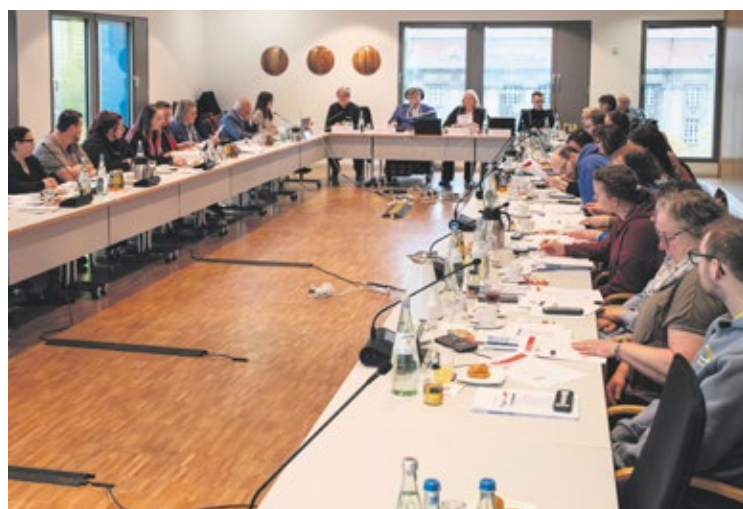
Vor Ort in der SoVD-Bundesgeschäftsstelle und über das Internet zugeschaltet stellten die Delegierten die Weichen für die Zukunft.

Nachzahlungen können Freibetrag überschreiten