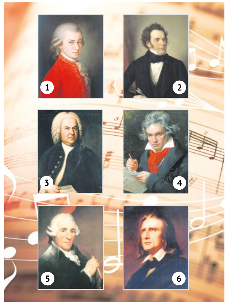
Grafik: BillionPhotos.com/Adobe Stock; Abbildungen: gemeinfrei

Dieses Mal ist „klassische“ Bildung gefragt. Kennen Sie diese sechs berühmten Komponisten? Als kleine Hilfe nennen wir hier immerhin schon einmal deren erste Vornamen. Sie lauten Ludwig, Joseph, Franz, Johann, Wolfgang und noch einmal Franz. Die Auflösung finden Sie wie immer auf Seite 18 dieser Ausgabe.