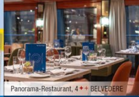
Panorama-Restaurant, 4++ BELVEDERE