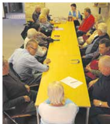
Das Publikum lauschte gebannt.

Das Publikum konnte nach der Lesung ihre Bücher kaufen und